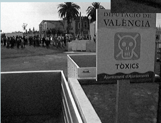
Contenedor de residuos tóxicos

sufrido previamente un proceso de reciclaje. Hace falta una acción pública más decidida y una mayor concienciación y colaboración empresarial y ciudadana. El desarrollo sostenible continuará siendo un concepto vacío si no recibe todo el apoyo y comprensión del público en general.