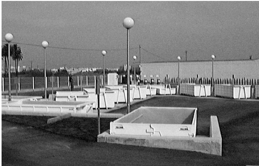
Aspecte general de l'ecoparc recentment inaugurat