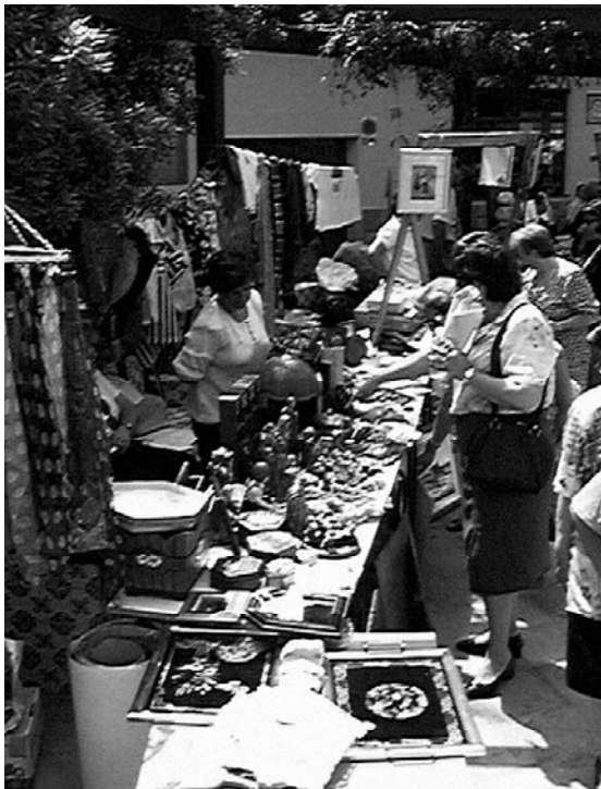
Una de les parades instal·lades a la plaça Major amb motiu del passat "Rastro" Solidari celebrat al mes de maig