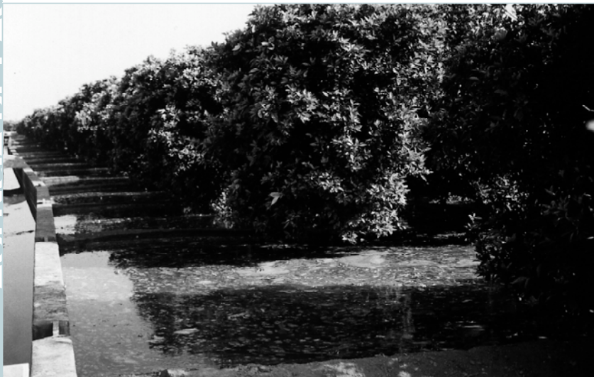
Reg tradicional al Realenc

El projecte per a la instal·lació de reg per goteig al Realenc ha donat enguany importants passos endavant al sí del Consell Agrari. Allí es presentà i aprovà el projecte per donar solució a totes les variables que incideixen al Realenc; com l'origen de l'aigua, l'agricultura a temps parcial, els diferents cultius i varietats, així com la importància de mantenir