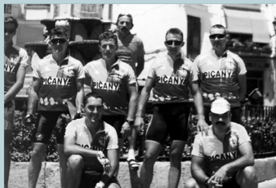
Part dels membres de la Peña Ciclista Tarazona que van prendre part a la "Marxa Cicloturista El Rail"