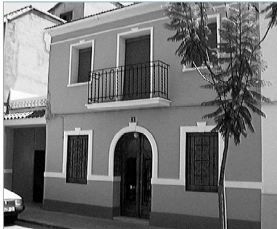
Las fachadas de las casas del casco antiguo de Picanya ya han comenzado a mejorar su aspecto gracias a este nuevo programa de subvenciones

La cuantía de las ayudas podrá llegar al doble del recibo del IBI de naturaleza urbana en las casas