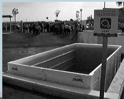
Contenedor de vidrio

do salva 14 árboles de 20 años de vida. Poner en marcha políticas de reciclaje es de vital importancia para la supervivencia del planeta, ya que actualmente generamos cinco veces más basura que durante los años 60. Otro dato. La producción estimada de basura en España es de 14 millones de toneladas/año, de las que sólo se revalorizan el 17%. El resto, el 83%, se arroja todavía en vertederos o incineradoras sin haber